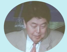
日本科学未来館から直 接金井さんと交信した 林芳正文部科学大臣