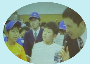
子どもたちの質問を 日本科学未来館会場に 伝えた文部科学省新妻 秀規大臣政務官