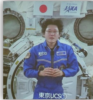
国際宇宙ステーションから 質問に答えてくれた 金井宣茂宇宙飛行士